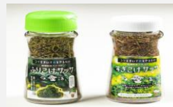
自社生産したスナゴケを使用したふりこけサッサ等の