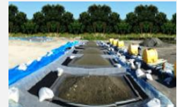
重金属汚染土壌の有害イオン吸着シート」の開発