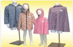
原子力災害時の避難弱者用放射線遮蔽服等の開発