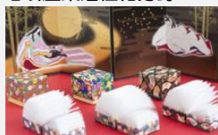
越前和紙「友禅柄」をプリントさせたキューブメモの開発